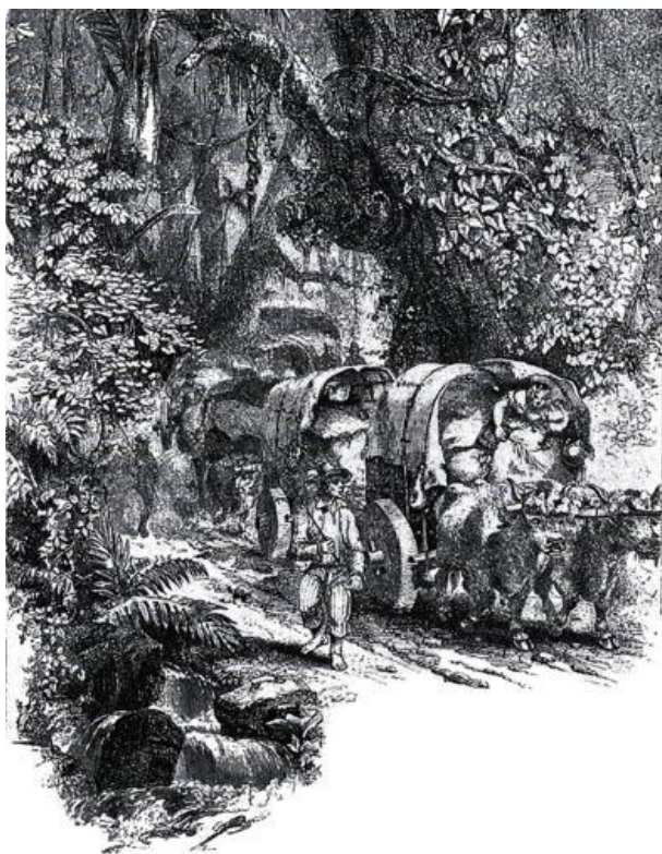
Carretas en el antiguo camino nacional

Para ello habilitaron este camino que hoy llamamos Calle Los Llanos que entronca a la Garita con San Rafael de Alajuela; para luego seguir por San Antonio de Belén, Asunción, La Pitahaya, El Barreal, la Valencia y llegar por ultimo a Río Virilla.